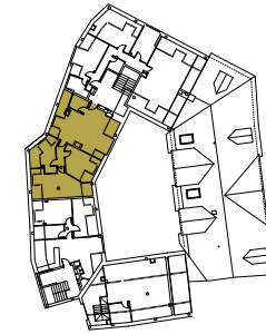
PLANTA TERCERA VIVENDA A SUPERFICIE ÚTIL